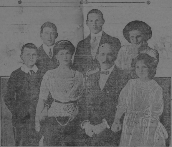
The ROYAL FAMILY OF GREECE